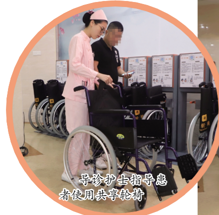
医护人员指导患者使用共享轮椅