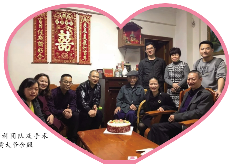
下肢一科团队及手术室医护人员与黄大爷合照