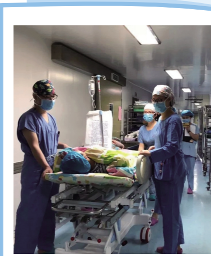
手术医生来说，无疑是一个极大的考验及挑战。

入院后，医生检查发现，除了骨折，老人还同时患有冠心病、房颤、心衰、肺炎、支气管哮喘等十多种并发症，这种手术，对病人和