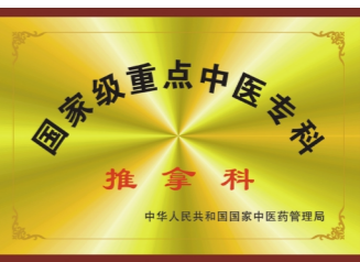
国家级重点中医专科——推拿科

士）保证手术期间安全、快速；重症处理团队（ICU医生、急救内科医生、经管医生）协助术后病情监护和病情调整；疼痛处理团队（经管护士、经管医生、疼痛科医生）从病人入院开始介入，通过疼痛评估，为病人制定个性化疼痛处理方案，保证病人住院期间安全、舒适、无痛。经过周密的准