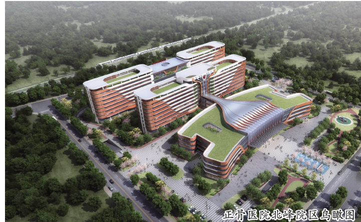
正骨医院北峰院区鸟瞰图