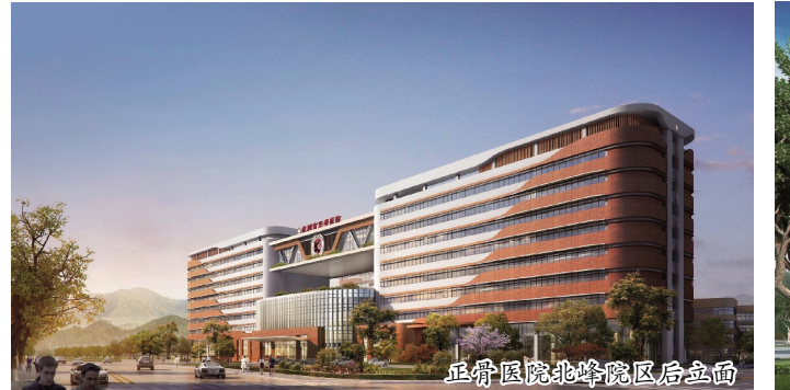
正骨医院北峰院区区鱼面

目前,医院开设有骨伤、推拿、康复、小儿骨科、关节科、脊柱科、运动医学科、风湿科、手外科、内科、外科、急救内科、ICU等二十余个临床科室。拥有1个“中华中医药骨伤名科”,1个国家级重点中医专科,7个省重点中医专科,1个“创双高”省级重点中医专科建设项目,4个市级重点中医专科。