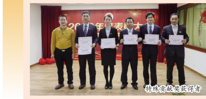
特殊贡献奖获得者