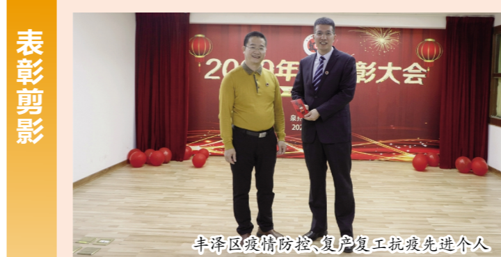
丰泽区疫情防控、复工复产抗疫先进个人

于担当、勇于奉献、成绩斐然的优秀团队及先进个人。会上对2020年度在疫情防控、科室管理、中医药文化、科教研等方面表现优异的科室、团体和个人进行了表彰颁奖，以鼓励全院职工以先进为榜样，不断提高医疗服务质量，为医院发展建设做出贡献。