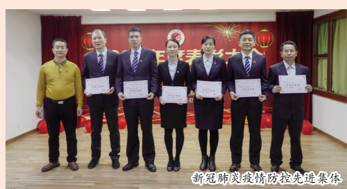
新冠肺炎疫情防控先进集体