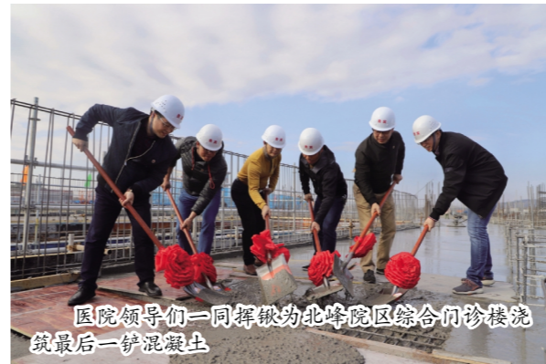
医院领导们一同挥锹为北峰院区综合门诊楼浇筑最后一铲混凝土