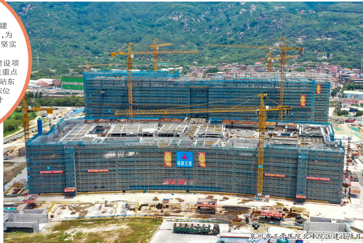
泉州市正骨医院北峰院区建设项目