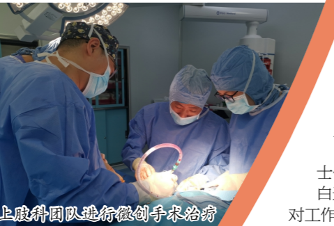
上肢科团队进行微创手术治疗