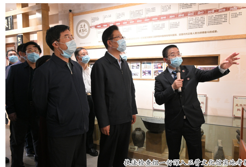
执法检查组一行深入正骨文化馆实地考察

4月13日,全国人大常委会副委员长张春贤率队执法检查组来泉,就《中华人民共和国中医药法》实施情况开展执法检查。全国人大常委会委员、教科文卫委员会副主任委员殷一璀,全国人大常委会委员、教科文卫委员会副主任委员杜玉波等参加检查。执法检查组一行深入到泉州市中医院、泉州市正骨医院文化馆、晋江市中医院等实地考察,了解中医药法