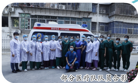
部分医疗队队员合影

同心抗疫，正骨人在行动 乌云遮月，疫情挡春 丰泽共克时艰，八闽同舟共济 必将守得云开见月明