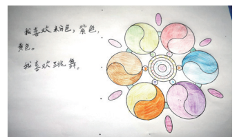
患儿参加病友会心理疏导小课堂时完成的画作

化诊疗服务模式，将医疗、护理、康复与心理健康服务结合起来，既在身体创伤方面提供诊疗、康复需求，同时及时给患儿提供心理疏导与咨询，为患者及家属提供更加全面、个性化、人性化的服务。